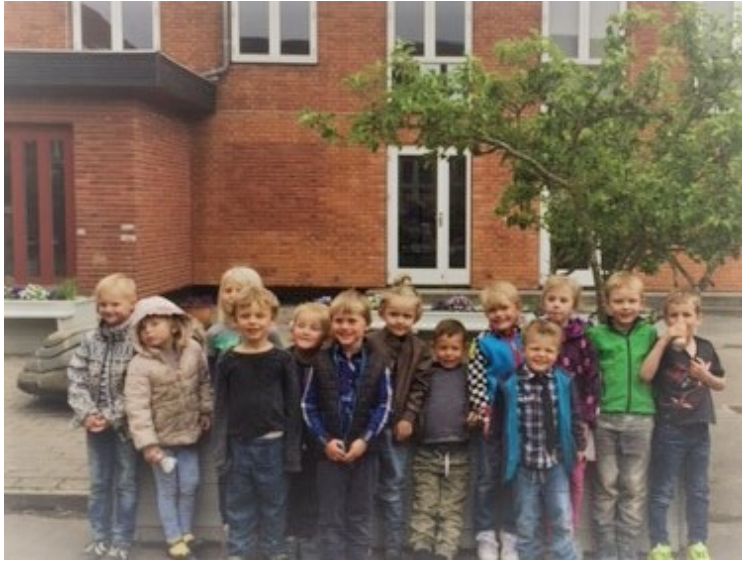
Børnehavebørn gør sig klar til skolestart..... :-)

Vi glæder os alle meget til at se jer alle til sommerfest på torsdag, hvor vi kan ønske hinanden god sommerferie ovenpå et godt og givende skoleår.