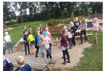
Billederne er fra klubbens høstfest d. 22. september