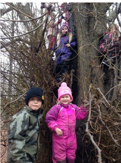
Børnehaveklassen på skovtur.

I klubben er der mulighed for at koge bolsjer tirsdag og torsdag i december måned. I SFOen står den –ud over diverse julerier - på historiefortælling og mindfulness.